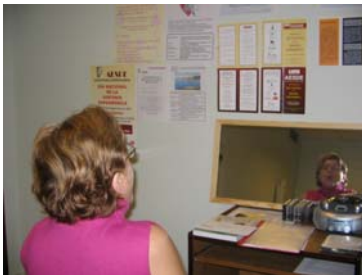
Participante en los ejercicios de Praxias

El taller se pudo realizar gracias a la subvención concedida por el Excmo. Ayuntamiento de El Puerto de Santa María.