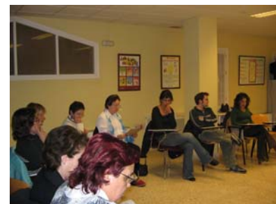
Participantes en el taller de Autoestima

Siguiendo con las actividades de talleres el 29 de Mayo comenzamos el taller de autoestima que anunciamos como “Taller practico en el que se utilizaran ejercicios y dinámicas de grupos en los que tomaremos conciencia de cómo nos dificultamos al amarnos a nosotros mismos, y que hacer para reparar nuestra autoestima” . Tuvo una gran acogida y no pudimos atender todas las peticiones por lo que tuvimos que repetir el taller el DIA 12 de Junio .