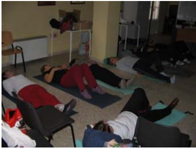
Participantes en el Taller de Fisioterapia