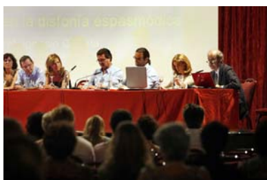
Clínica ORL. Hospital Puerta del Mar de Cádiz). Mesa redonda titulada: "Disfonía